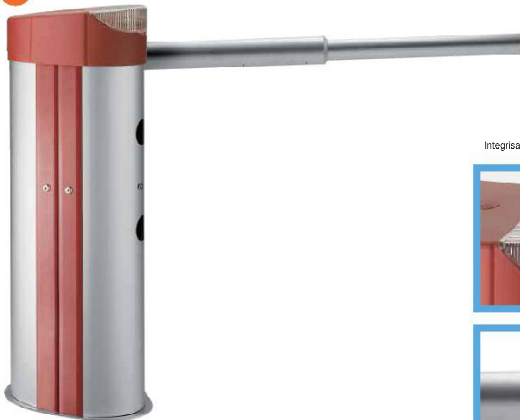
Integrirana signalna lampa