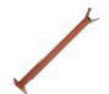
DA011 Fiksni oslonac ruke, podesiv po visini.