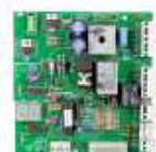
DA1000 Kontrolna jedinica za Daphne rampe.