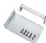
DA019 Set za fiksiranje baterije 3Ah