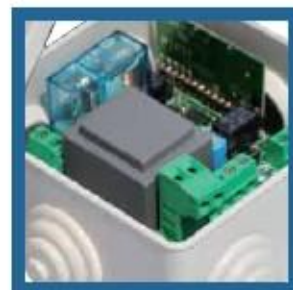
Novi prijemnik Energy.